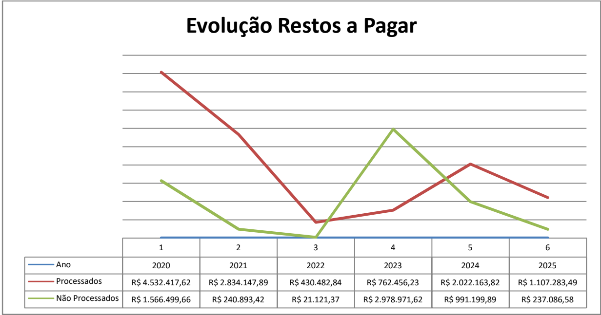
Gráfico – Evolução dos Restos a Pagar

Entre 2024 e 2025, verifica-se uma redução expressiva de 55,37% no total de restos a pagar inscritos, representando uma melhoria significativa na gestão fiscal e orçamentária, como pode ser observado a seguir: