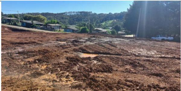
FOTO 1 - VISTA FRONTAL