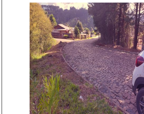
FOTO 5 - VIA DE ACESSO E ENTORNO