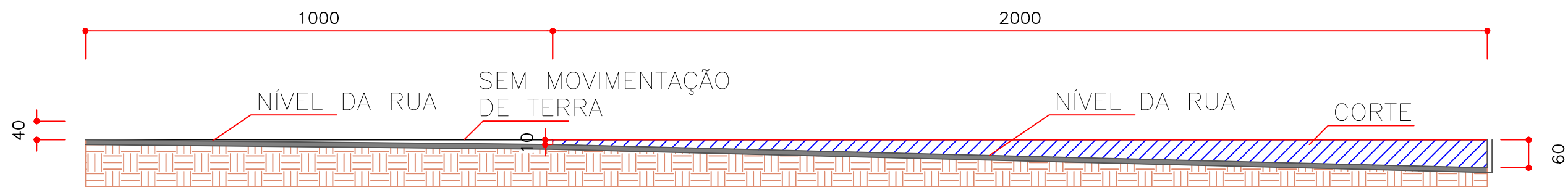
CORTE A-A ESC. 1:100