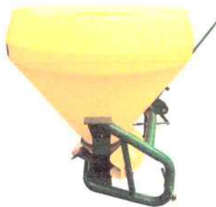
MQ-600 (vista lateral)