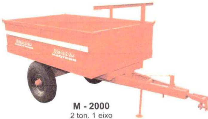
M - 2000 2 ton. 1 eixo