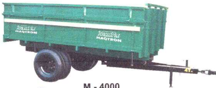
M - 4000 4 ton. rodado duplo