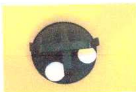
Duas saídas e mexedor