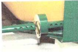
Regulagem de vazão