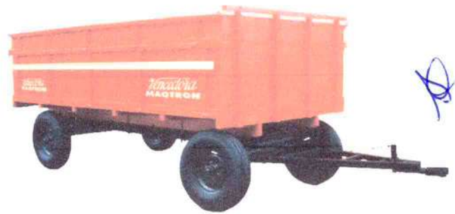
B - 900 5 ton. 2 eixos