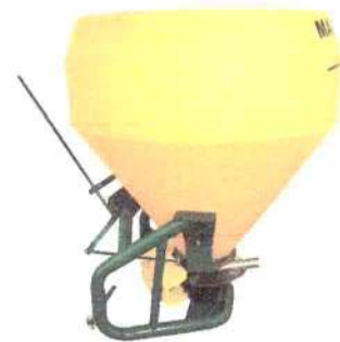
MQ-900 (vista lateral)