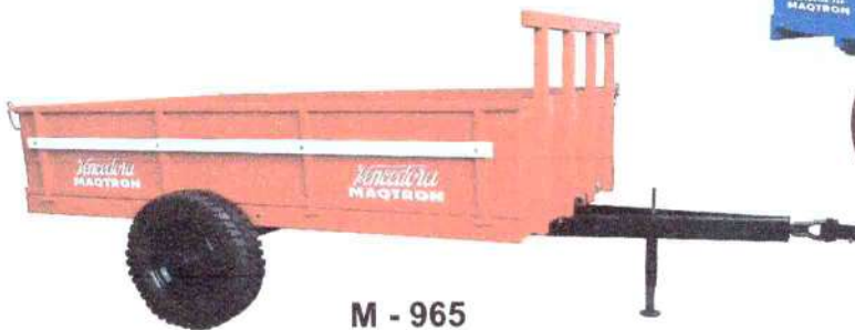
M - 965 (rodado por fora) 3,5 ton. 1 eixo (sem freio)