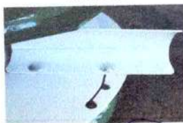
Regulagem de lançamento do produto