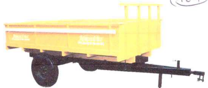
B - 960 3 ton. 1 eixo