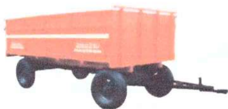
B - 900