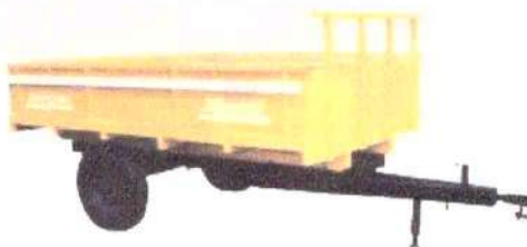
B - 960