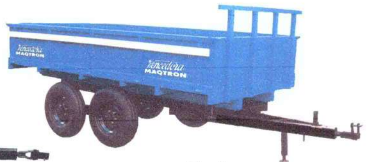
Tandem 5 e 6 ton.