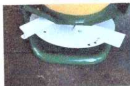
Discos e pás com pintura eletrostática ou inox (opcional)